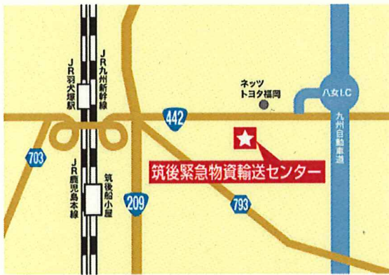
(公社)福岡県トラック協会 筑後緊急物資輸送センター (2階研修室)