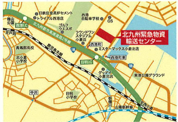
(公社)福岡県トラック協会 北九州緊急物資輸送センター (2階研修室)