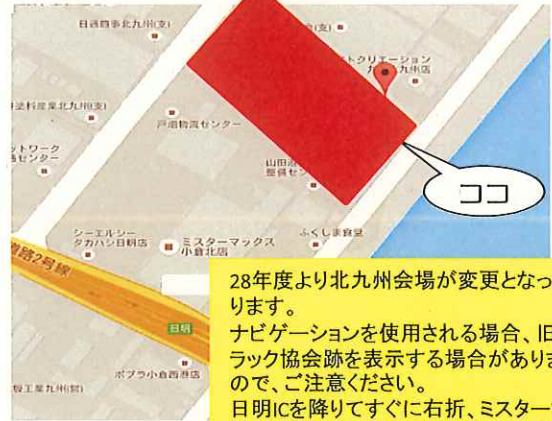
(公社)福岡県トラック協会 北九州緊急物資輸送センター (2階研修室)