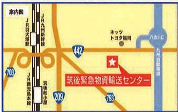
(公社)福岡県トラック協会 筑後緊急物資輸送センター (2階研修室)